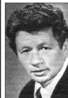
Статтю підготувала Євгенія Ковальчук