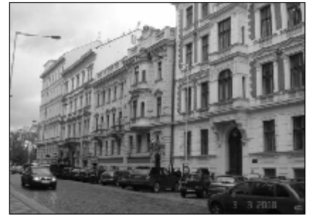
Будівля економічного факультету Карлова університету

У ході зустрічей було визначено напрямки та форми можливого спів-