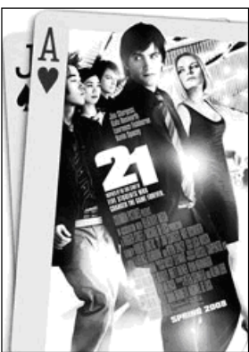
Матеріал підготувала Оля Чухліб