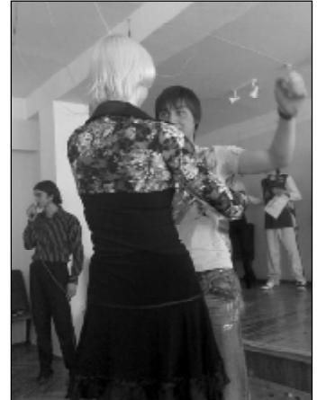
Вручение главного приза "Женщины любят ушами, а мужчины глазами!"

справились отлично и получили максимальное количество баллов. Права народная мудрость: