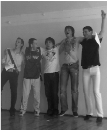
Все учасники "Мистер ГАСУА"

24 апреля Государственная академия - учета и аудита провела конкурс под названием "Мистер ГАСУА-2008". Тема конкурсов подарила зрителям океан незабытых впечатлений.